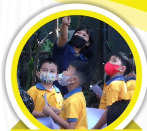
SD (Kelas 1)