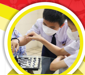
SMP (Kelas 7)

Gelombang 1 (30 September - 27 Oktober 2023)