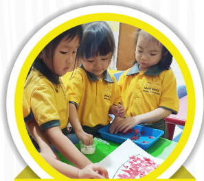
Kelompok Bermain dan TK