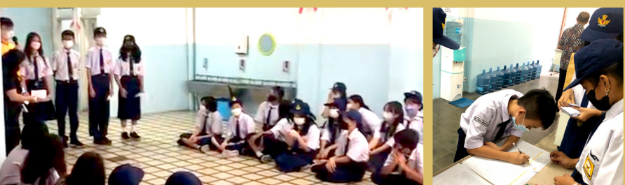
Proses kampanye dan pemilu yang diikuti oleh seluruh warga SMP Terang Nusantara