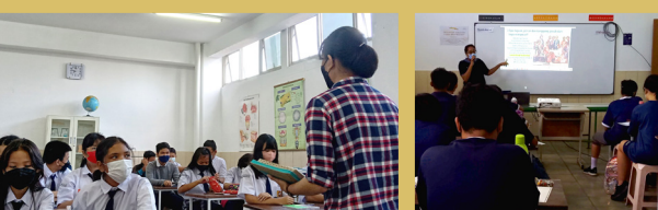
Pelatihan dan Pelantikan OSIS tahun ajaran 2022/2023