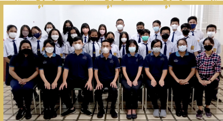
(atas) Anggota OSIS dan guru-guru SMP Terang Nusantara (bawah) Tim inti dan pembina OSIS tahun ajaran 2022/2023

Peserta didik pada jenjang menengah ke atas perlu dipersiapkan untuk memiliki jiwa pemimpin dan kemampuan bekerjasama dalam menghadapi berbagai persoalan sehari-hari. SMP Terang Nusantara memfasilitasi kebutuhan tersebut dengan membangun sebuah wadah berorganisasi, yakni OSIS (Organisasi Siswa Intra Sekolah). Murid yang tergabung akan dilatih memiliki pola pikir kritis untuk menyelesaikan masalah dengan sudut pandang yang menyeluruh dalam menyusun perencanaan kompleks, dan mengelola sumber daya manusia di sekitarnya berdasarkan talenta masing-masing untuk kepentingan bersama.